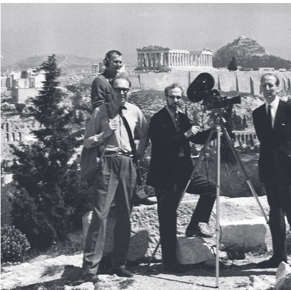
1. Ett bekymrat filmteam i Aten, där Bengt Roslund fick problem med tullen och inställda intervjuer. En hjälpsam och filmtresserad biskop blev regelbundet. 3. Gustaf VI Adolf var mån om sin gräsmatta och när filmteamet dokumenterades hans klockgolf fick de rådet att filma barfota, vilket kände sig sjuk och låg hemma och sov. En granne skickades in för att väcka henne med förevändningen att hon ville låna kaffe.