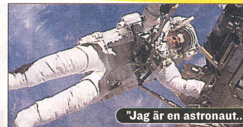
"Jag är en astronaut..."

Ungdomar har högtflygande planer. Nästan varannan av våra unga vill ut i rymden enligt en undersökning gjord av Rymdstyrelsen.